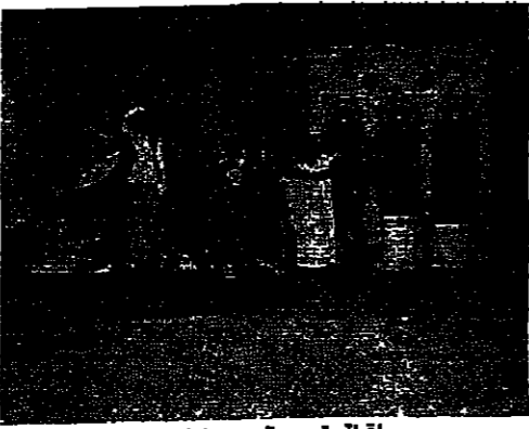
لقطة تعبيرية من «ماريس»